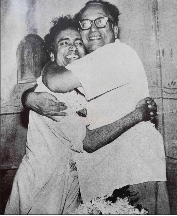
अमर शाहीर आणि आचार्य अत्रे