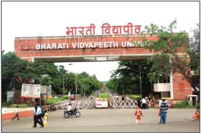
भारती विद्यापीठ प्रवेशद्वार, धनकवडी, पुणे.