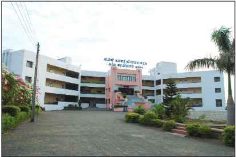
मातोश्री बयाबाई श्रीपतराव कदम कन्या महाविद्यालय, कडेगाव