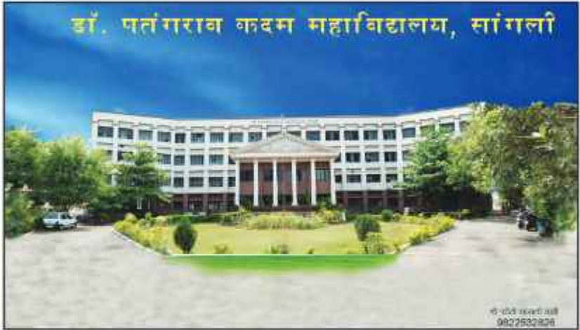
डॉ. पतंगराव कदम महाविद्यालय, सांगली