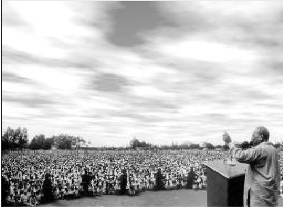
आटपाडी येथील पाणी परिषद – संघर्ष पाण्यासाठी....