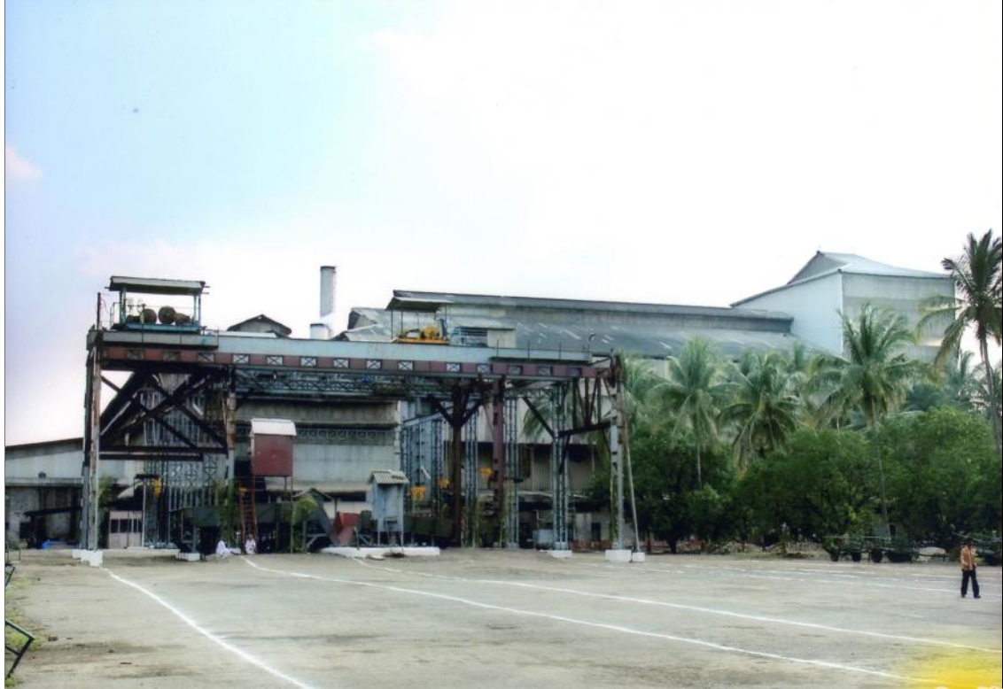
हुतात्मा किसान अहिर सहकारी साखर कारखाना, वाळवा