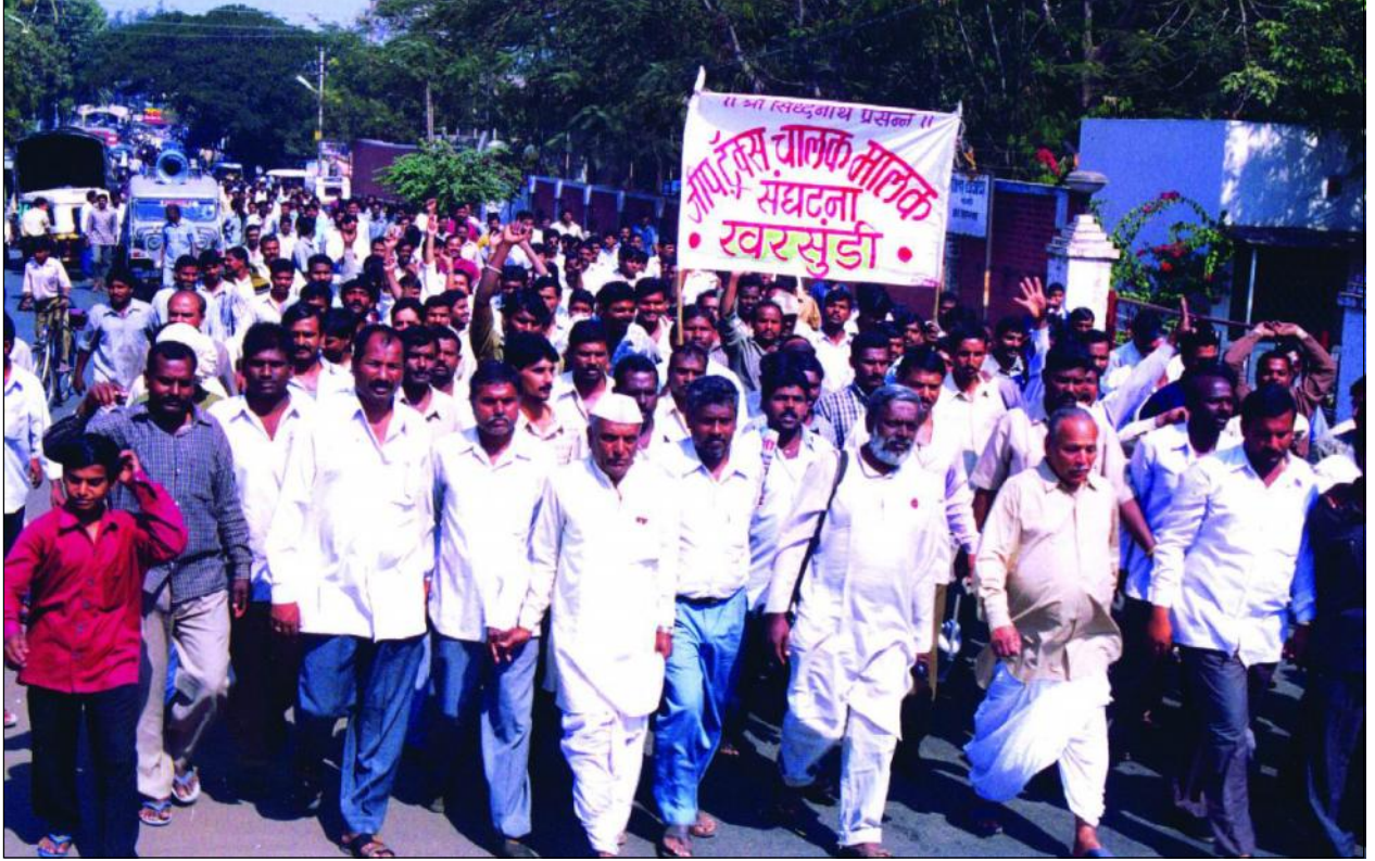
खासगी वाहतूकदार संघटनेच्या आंदोलनात नागनाथअण्णा नायकवडी