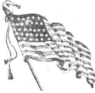
युनाइटेड स्टेट्स्ची नक्षत्रांक पताका