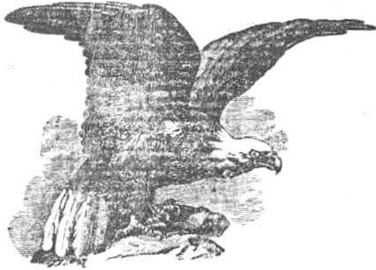
युनाइटेड स्टेट्स्च्या शिक्यावरील गरुड पक्षी