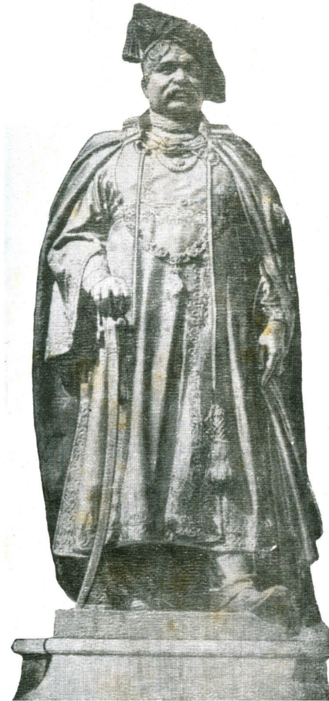
राजर्षी छत्रपती शाहू